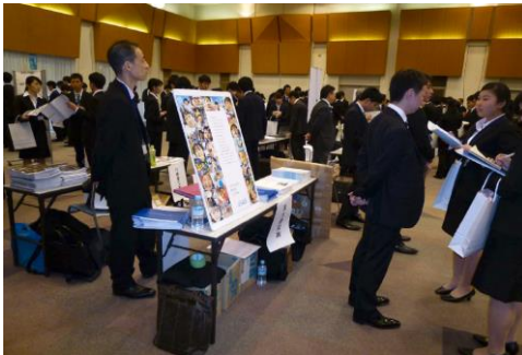
エンジニアリング産業研修会(東京)

また、多くの日系エンジニアリング企業や関連企業が進出している東南アジアにおいてもその人材育成の一環として開催した「海外プロジェクトマネジメント・トレーニングコース」が好評であったため、今後一層参加者が増加することが期待されるとともに、マレーシア（クアラルンプール）、インドネシア（ジャカルタ）及びタイ（バンコク）以外での新たな国・都市での実施も検討したい。