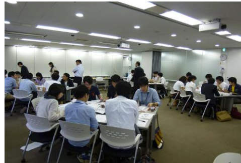
エンジニアリング体験セミナー