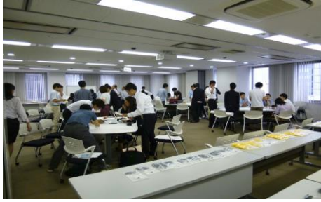
エンジニアリング体験セミナー(レゴ演習)