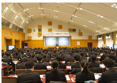
エンジニアリング産業研修会(東京)

更に、海外、特に東南アジアに進出している日系エンジニアリング企業の現地従業員を中心としたローカルスタッフに対して、系統立てたプログラムを企画・検討することにより「海外プロジェクトマネジメント・トレーニングコース」を実施し、技術の向上に努めた。