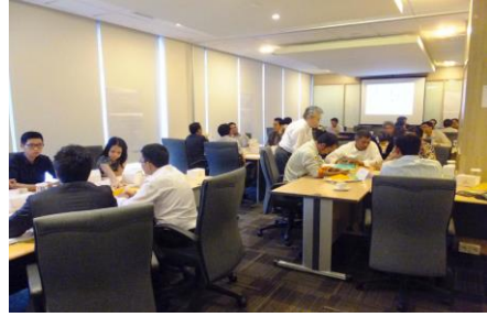
海外 PM トレーニングコース(ジャカルタ)