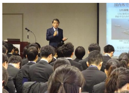
エンジニアリング産業研会(大阪)